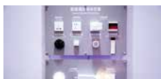
智能家居解决方案